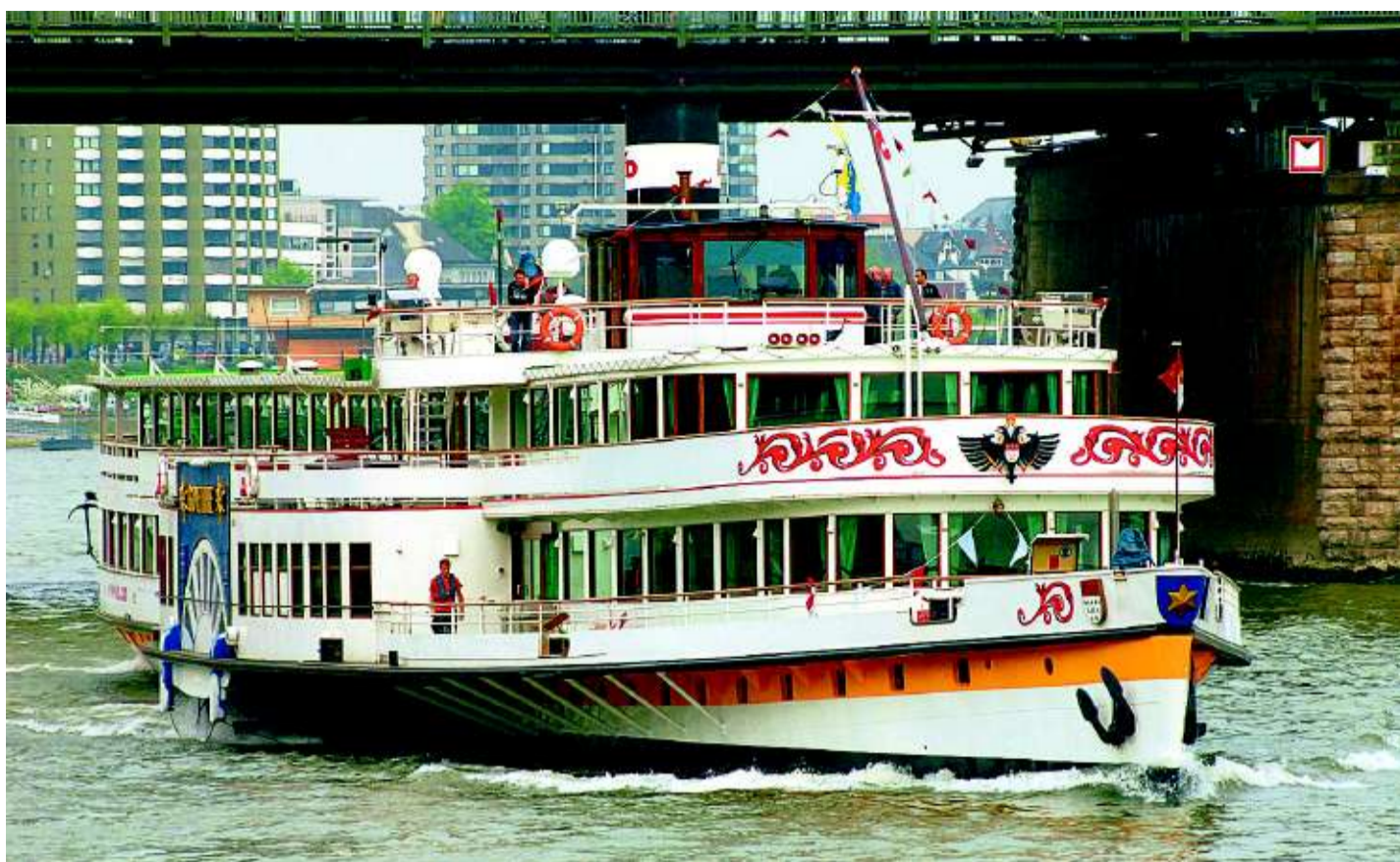
Seit 1913 ist die „Goethe“ auf dem Rhein unterwegs, jetzt aber mit Dieselmotoren.