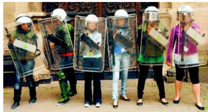
Die Pforte bewachen mit Schutzschild und in graziolen Schuhen: Die Mädchen dürfen Polizistinnen sein beim „Girls' Day“.

Doch nicht nur Hündin Sascha muss arbeiten, die Mädchen sollen selbst ausprobieren, wie es sich anfühlt, in voller Montur zu stecken – Schutzweste, doppelt gefütterte Hose, Jacke, Schienbein- und Kniebeschützer, Pistolengurt und Helm. Bei der Vorstellung, jetzt auch noch rennen zu müssen, stöhnen sie. Also kriegen sie die Aufgabe, den Eingang zum Andreaskloster zu versperren. Zaghaft halten sie die Schutzschilde hoch, die anderen